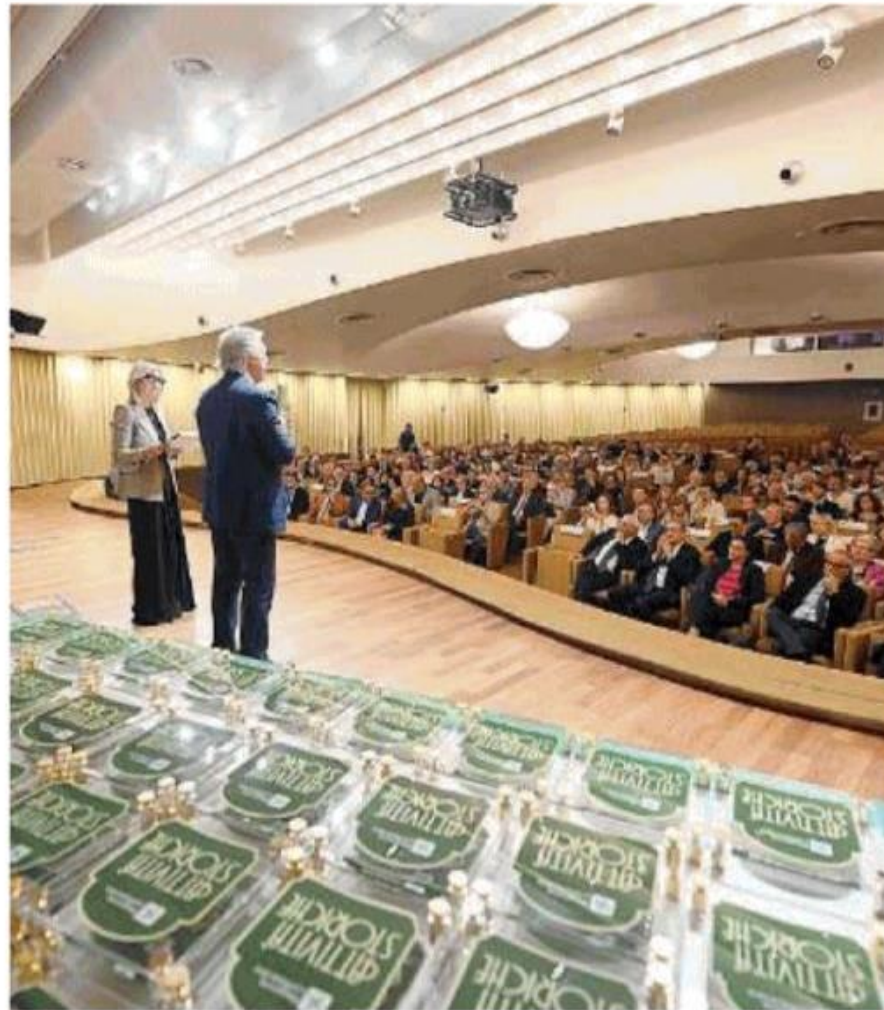
Cerimonia. I bresciani premiati in via Einaudi