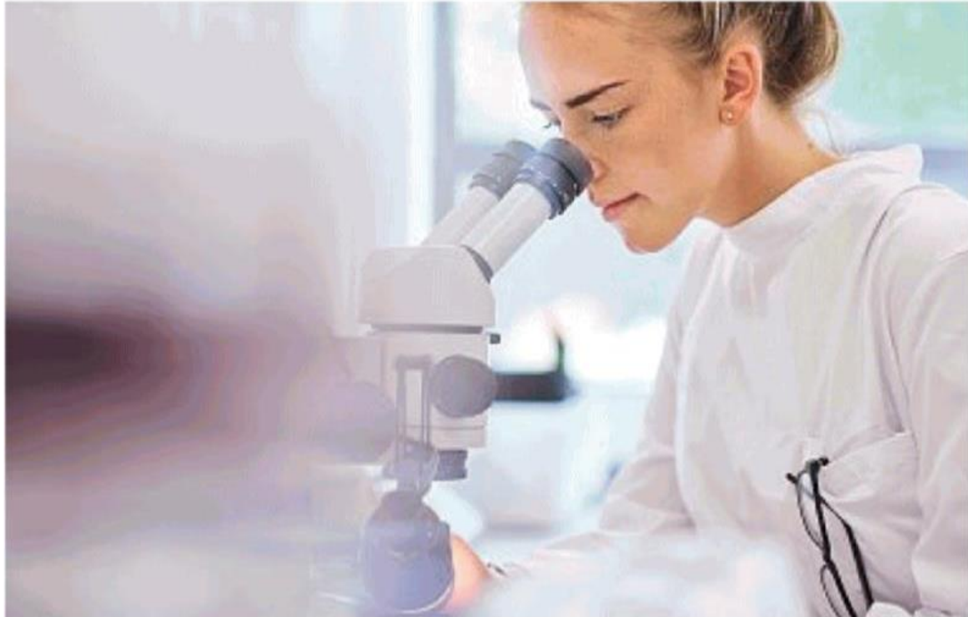
Una ricercatrice al lavoro